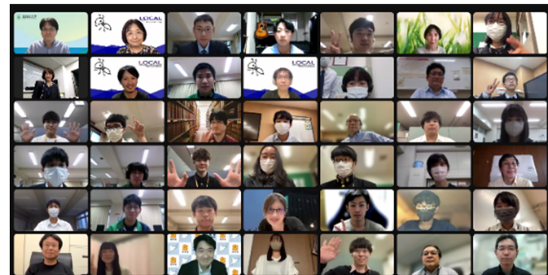
<2022年度の開催の様子>